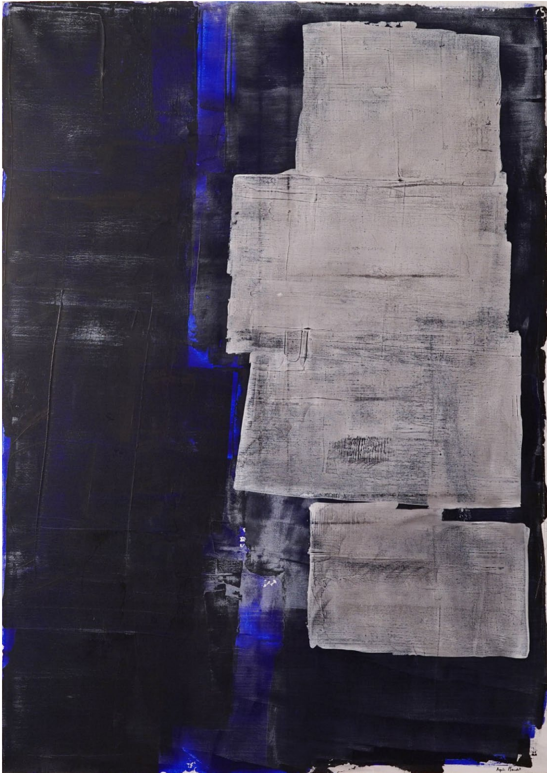
" Exterieur nuit", Agnes Baudet acrylique sur toile 162"114 cm 2017