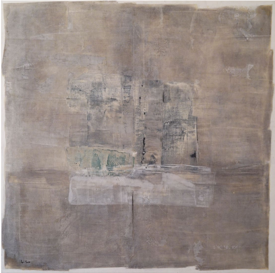
" Espace temps", Agnes Baudet ● acrylique sur toile 150"150 cm 2017