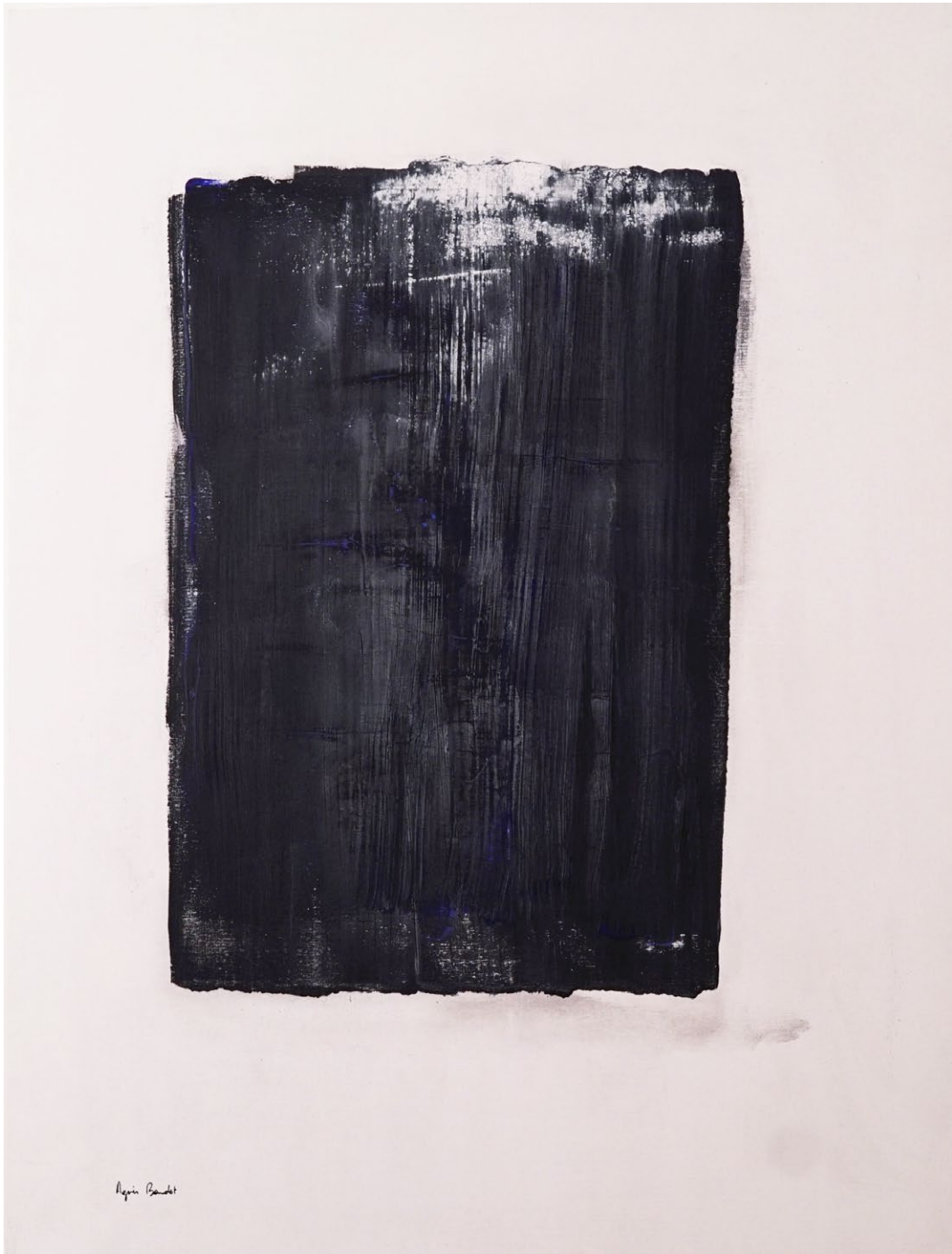
" Ivresse du pouvoir", Agnes Baudet ● acrylique sur toile 130"97cm 2017