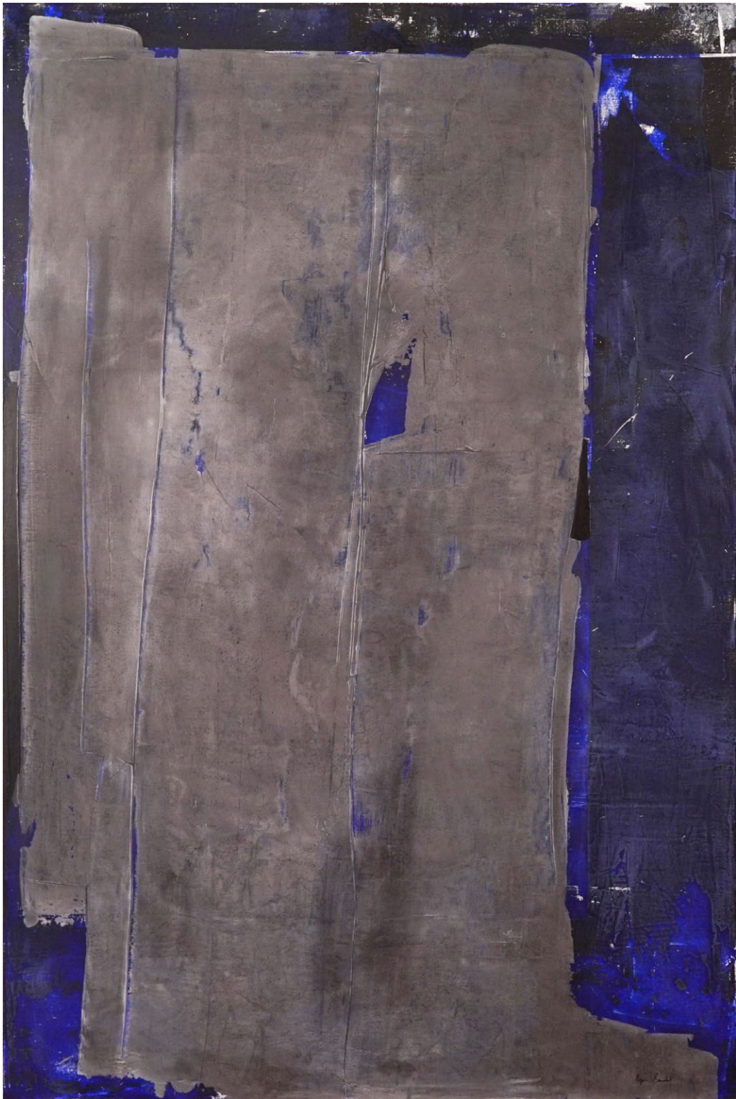
" La possibilité d'une île", Agnes Baudet ● acrylique sur toile 195"130 cm 2017