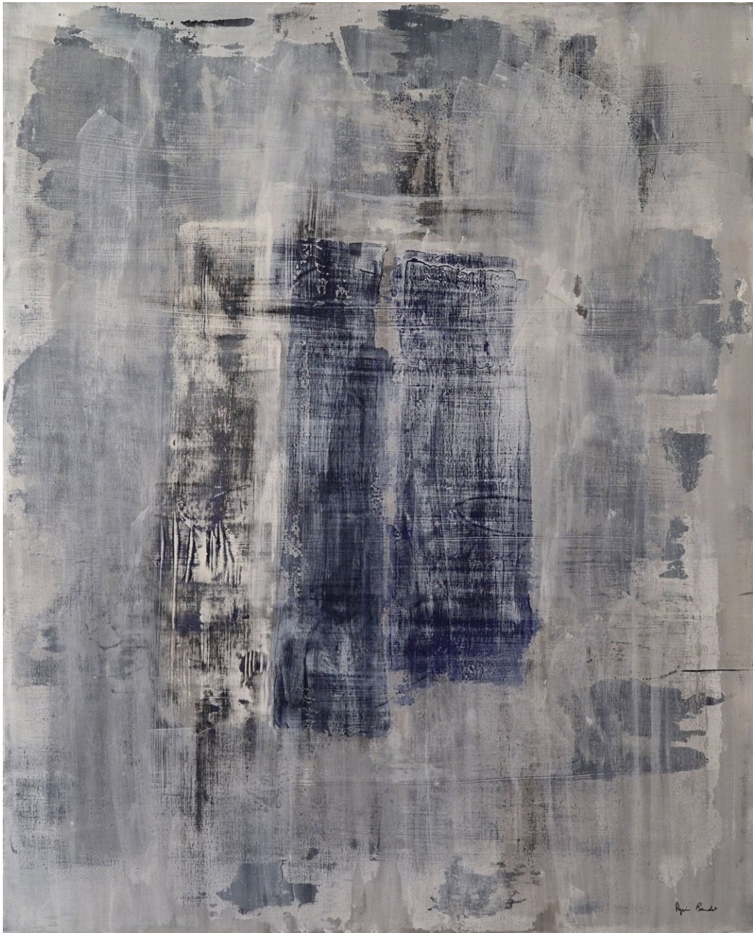
"Et le modele cessa d'etre", Agnes Baudet acrylique sur toile 162"130cm 2017