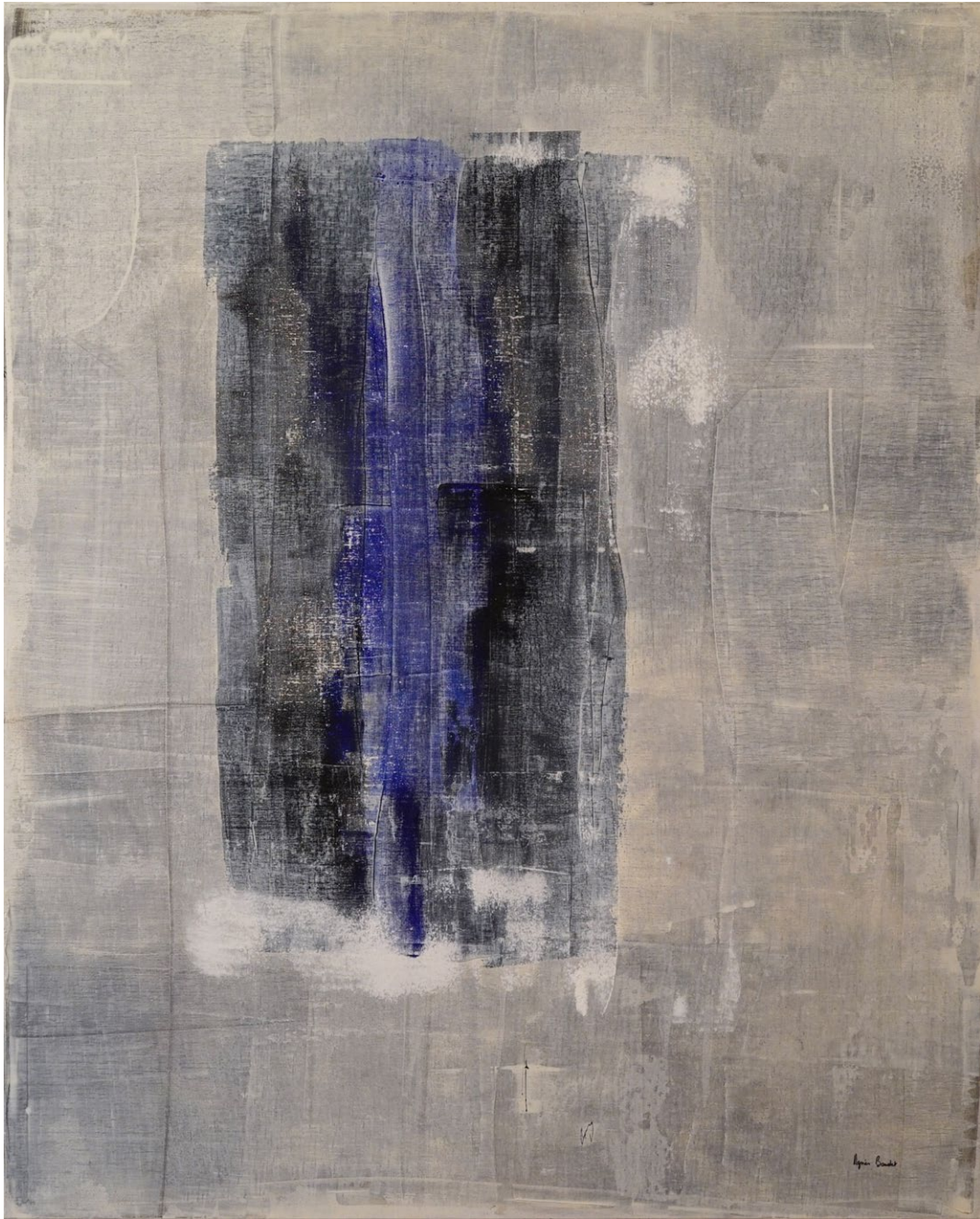
"Tensions intracommunautaires", Agnes Baudet acrylique sur toile 162"130cm 2017