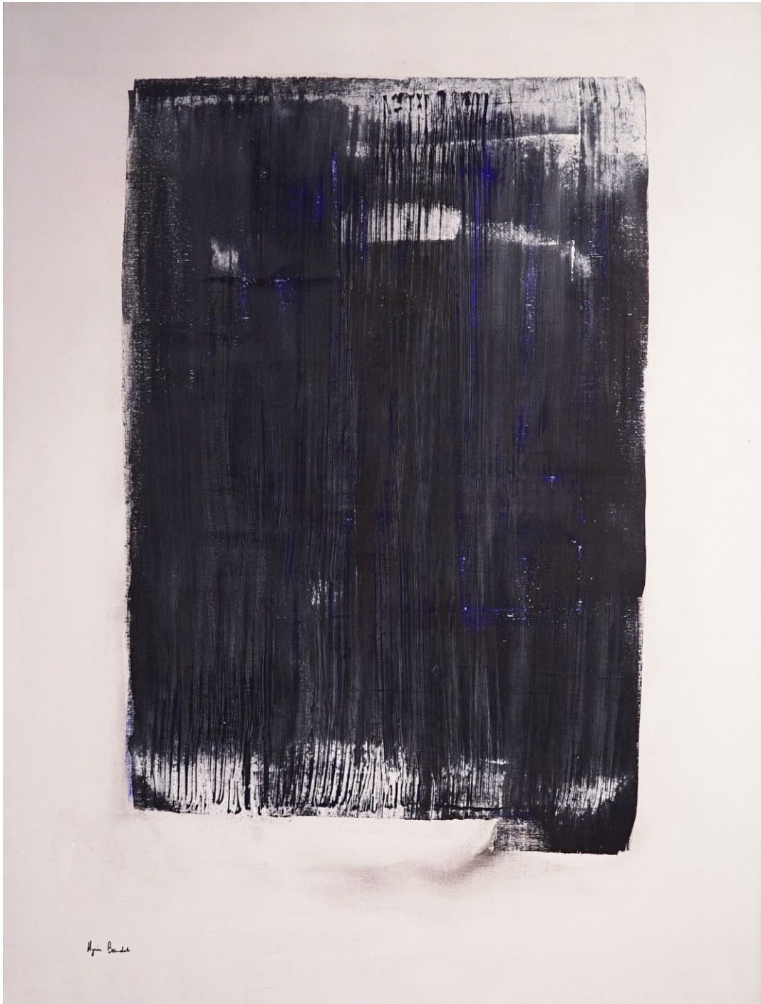
"Soumission volontaire", Agnes Baudet acrylique sur toile 130"97cm 2017