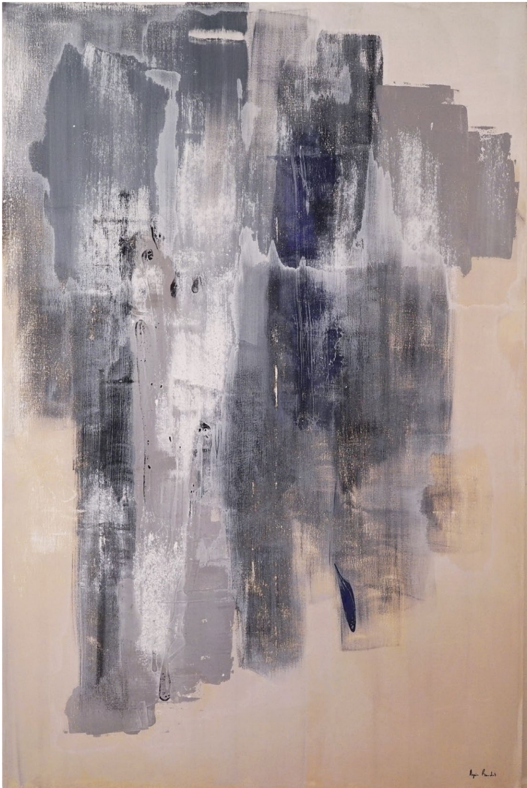
"Tentative critique sur l'évidence" Agnes Baudet, acrylique sur toile 195"130 cm 2017