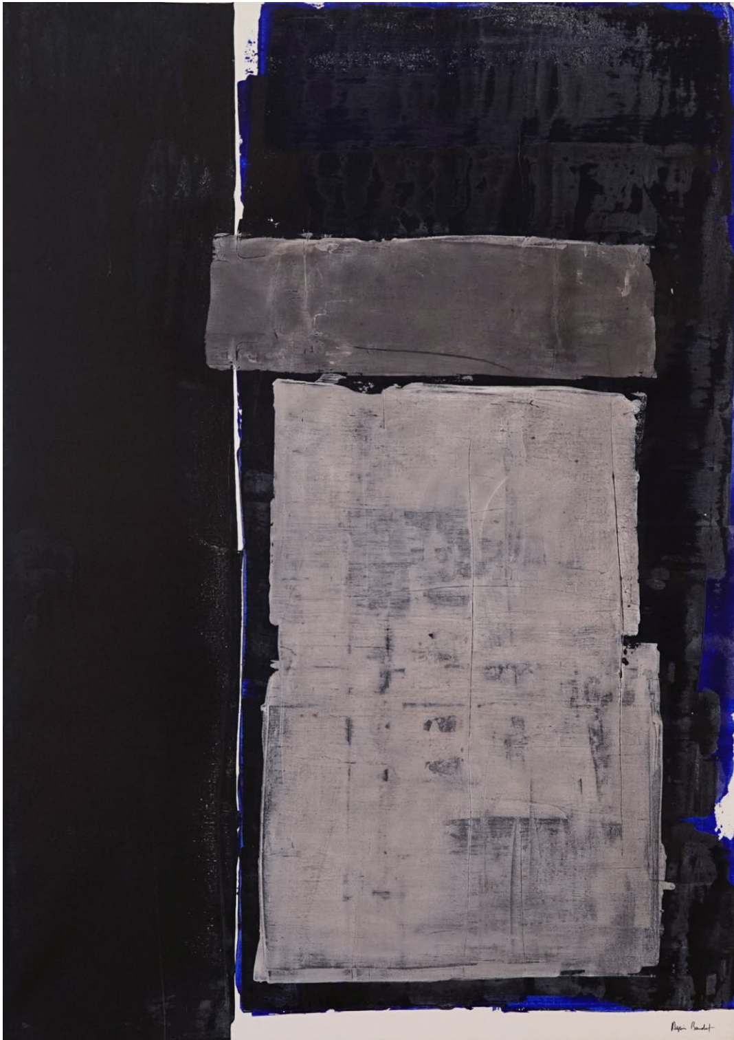
" L'impossible oubli", Agnes Baudet ● acrylique sur toile 162"114 cm 2017