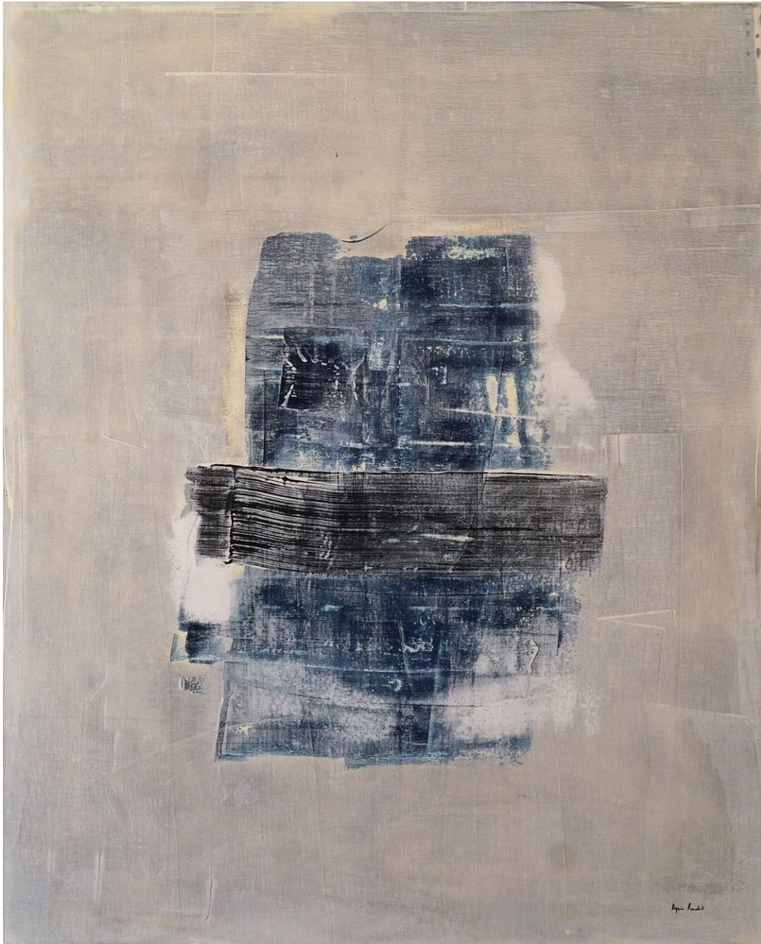
" Interference émotionnelle", Agnes Baudet acrylique sur toile 162"130cm 2017