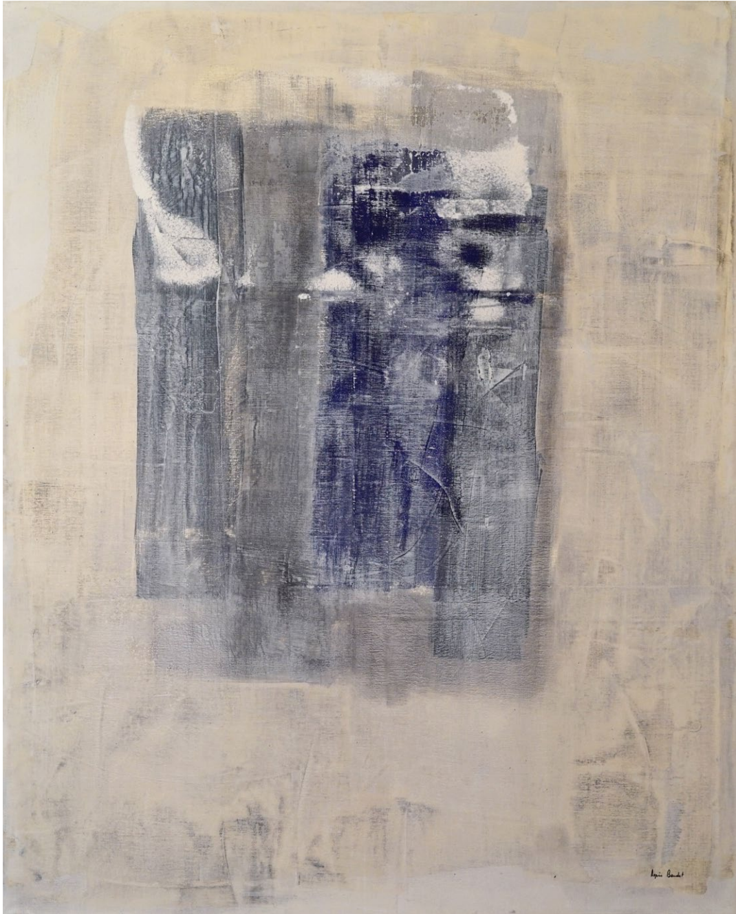
"Hierarchisation des universaux", Agnes Baudet acrylique sur toile 162"130cm 2017