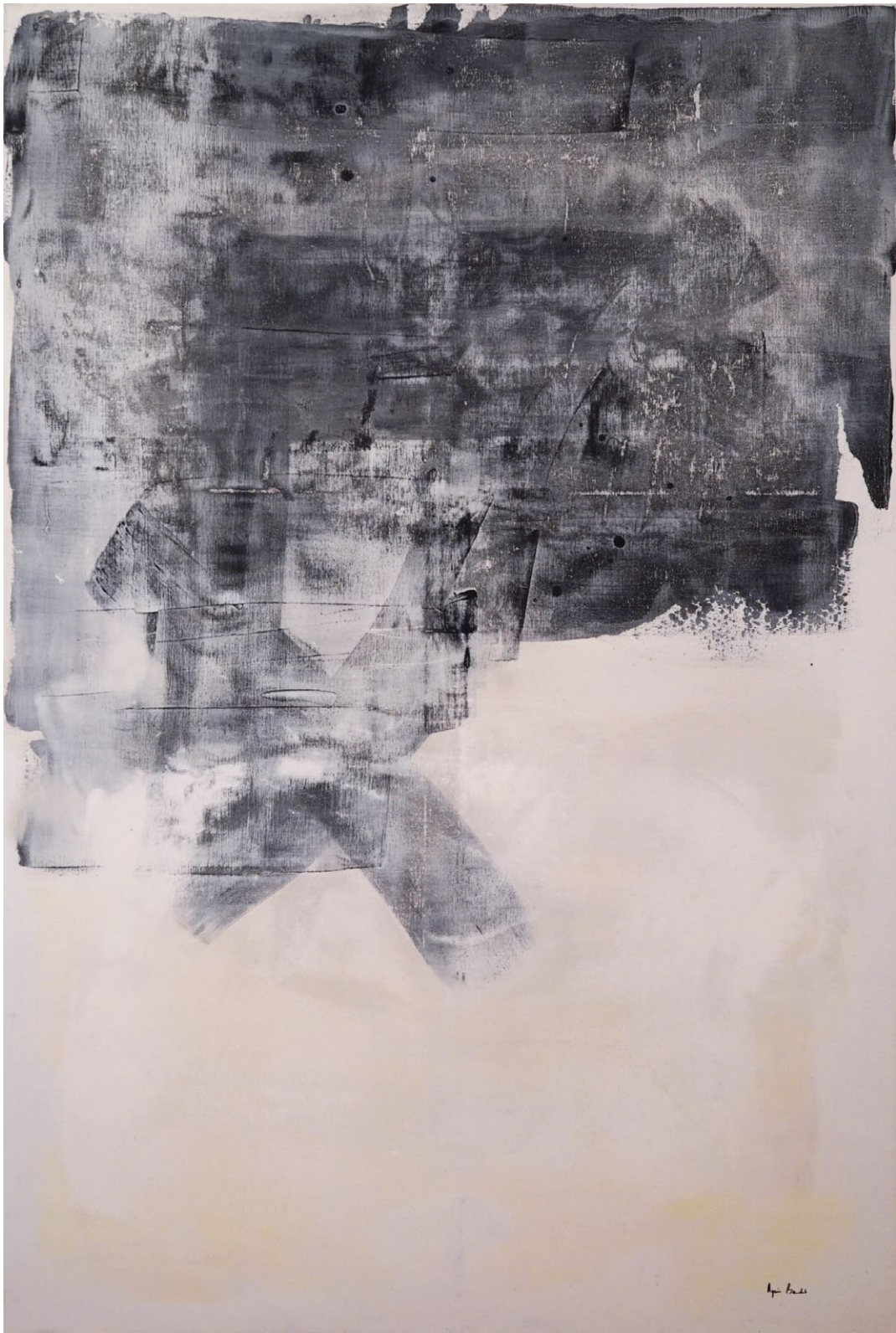
" Tentative d'objectivation", Agnes Baudet acrylique sur toile 195"130 cm 2017