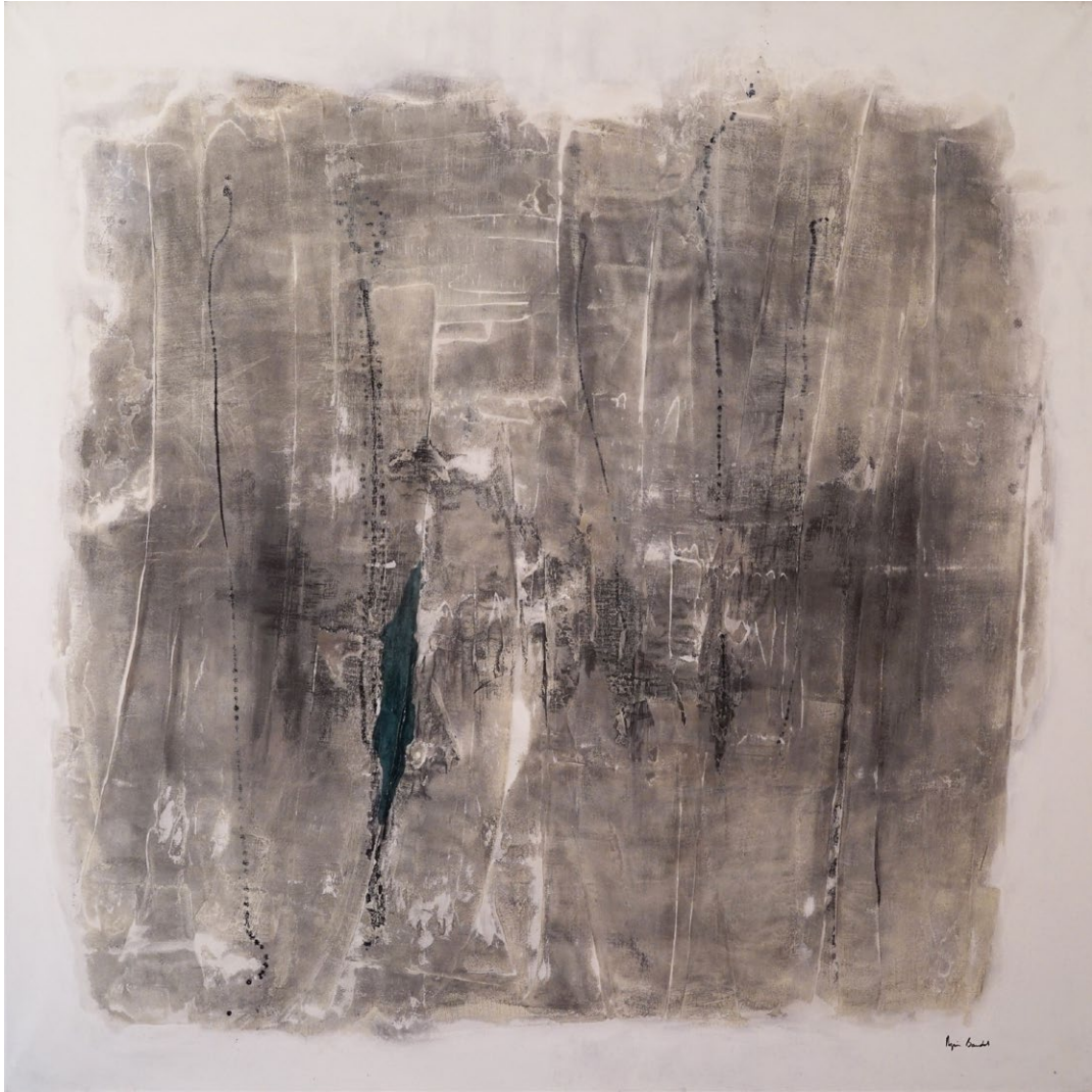
"Metaphore de l'oubli", Agnes Baudet acrylique sur toile 150"150 cm 2017