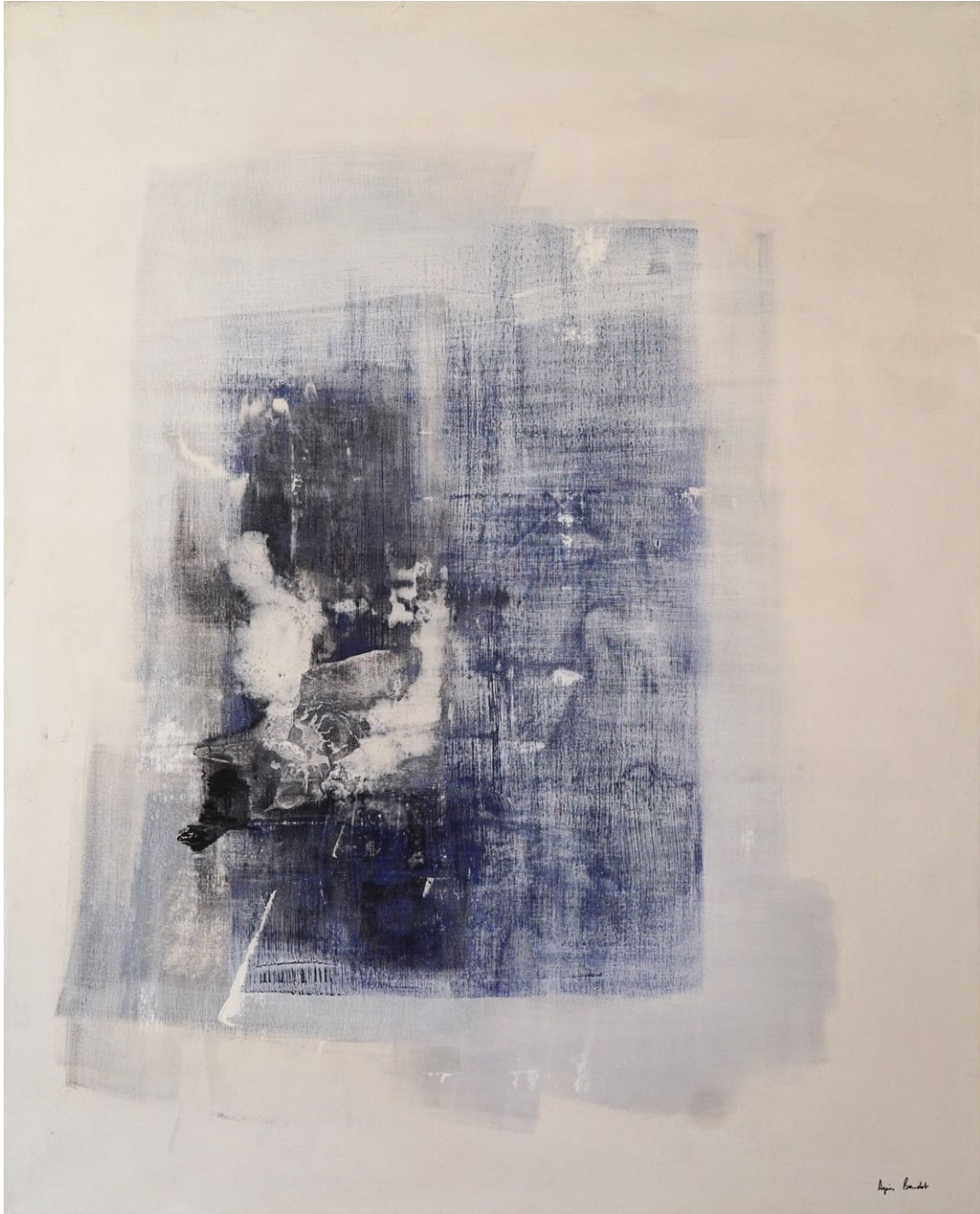
"Condition de vérité", Agnes Baudet ● acrylique sur toile 162"130cm 2017