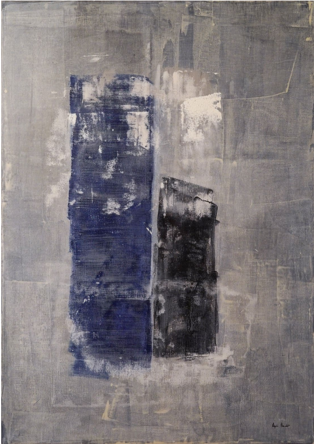
"Implémentation", Agnes Baudet acrylique sur toile 162"114cm 2017