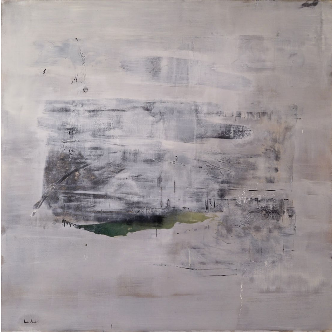
" A partir du jugement premier", Agnes Baudet acrylique sur toile 150"150 cm 2017