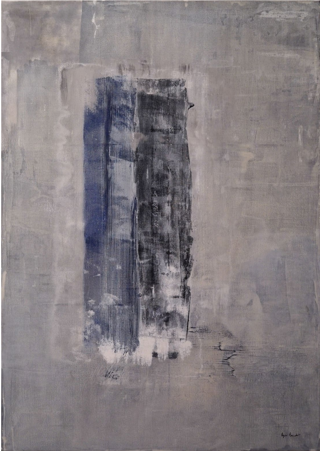
"Latitude de pensée", Agnes Baudet ● acrylique sur toile 162"114cm 2017