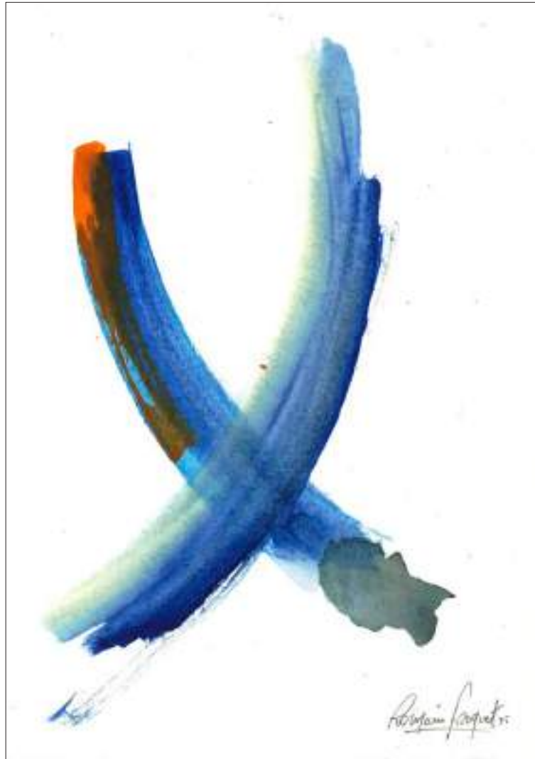
Etude Vitrail #1 20,9 x 14,7 cm Aquarelle sur papier 2026