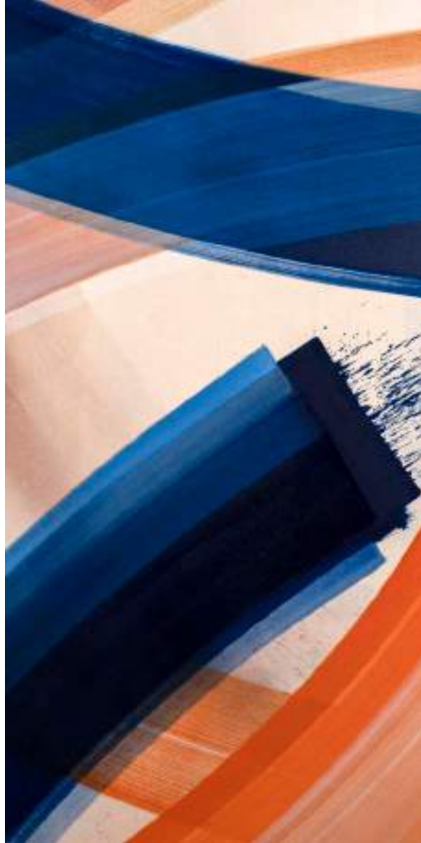
Gesture - Lumière #2