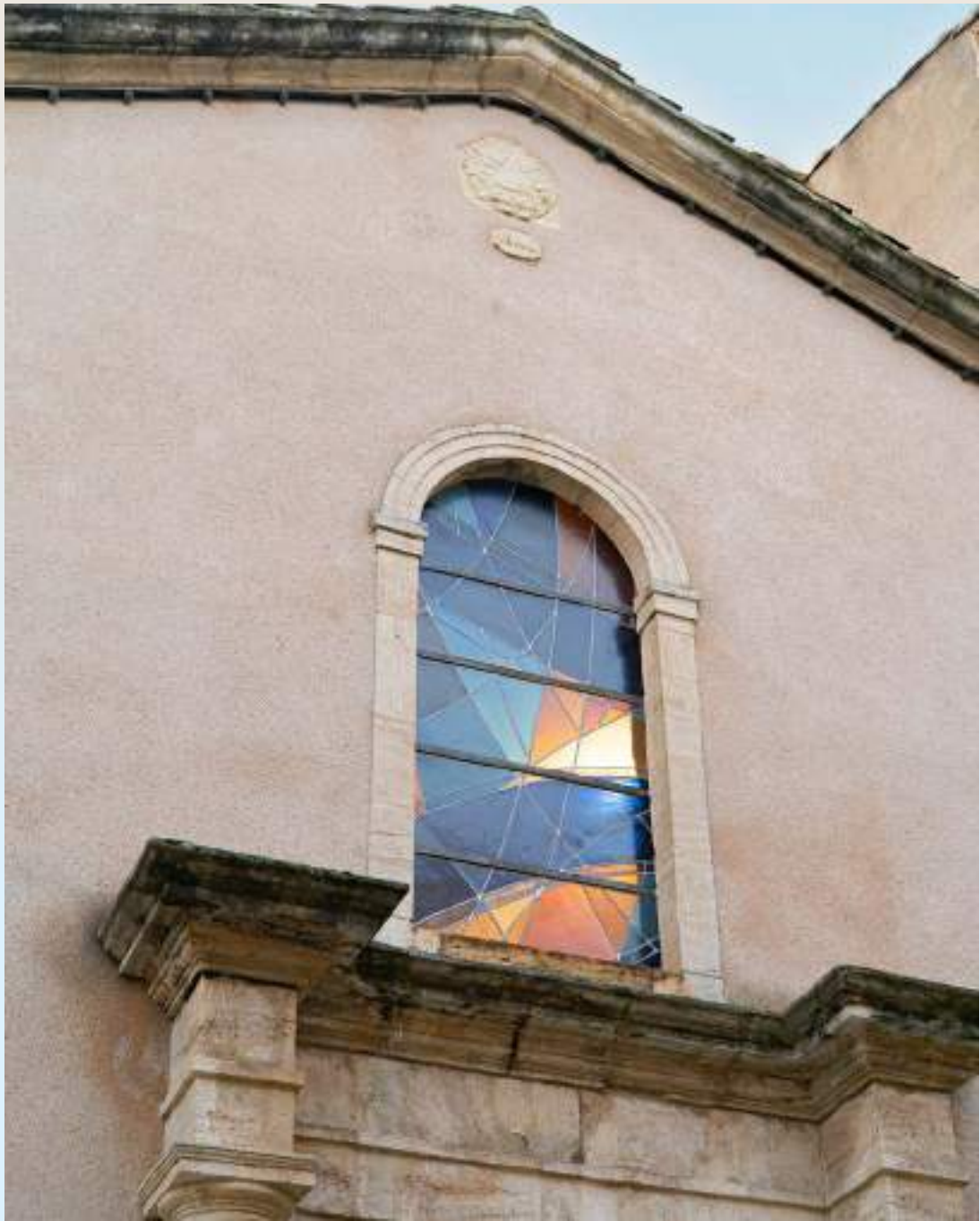
LA CHAPELLE DES PÉNITENTS DE PÉZENAS