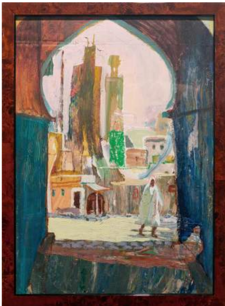
Bad Boujloud 29 x 20 cm Huile sur papier 2024