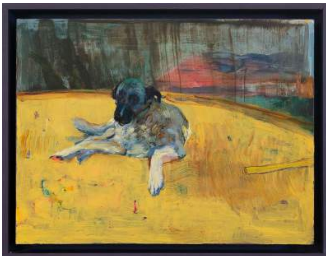
Sombra 25 x 33 cm Huile sur bois 2025