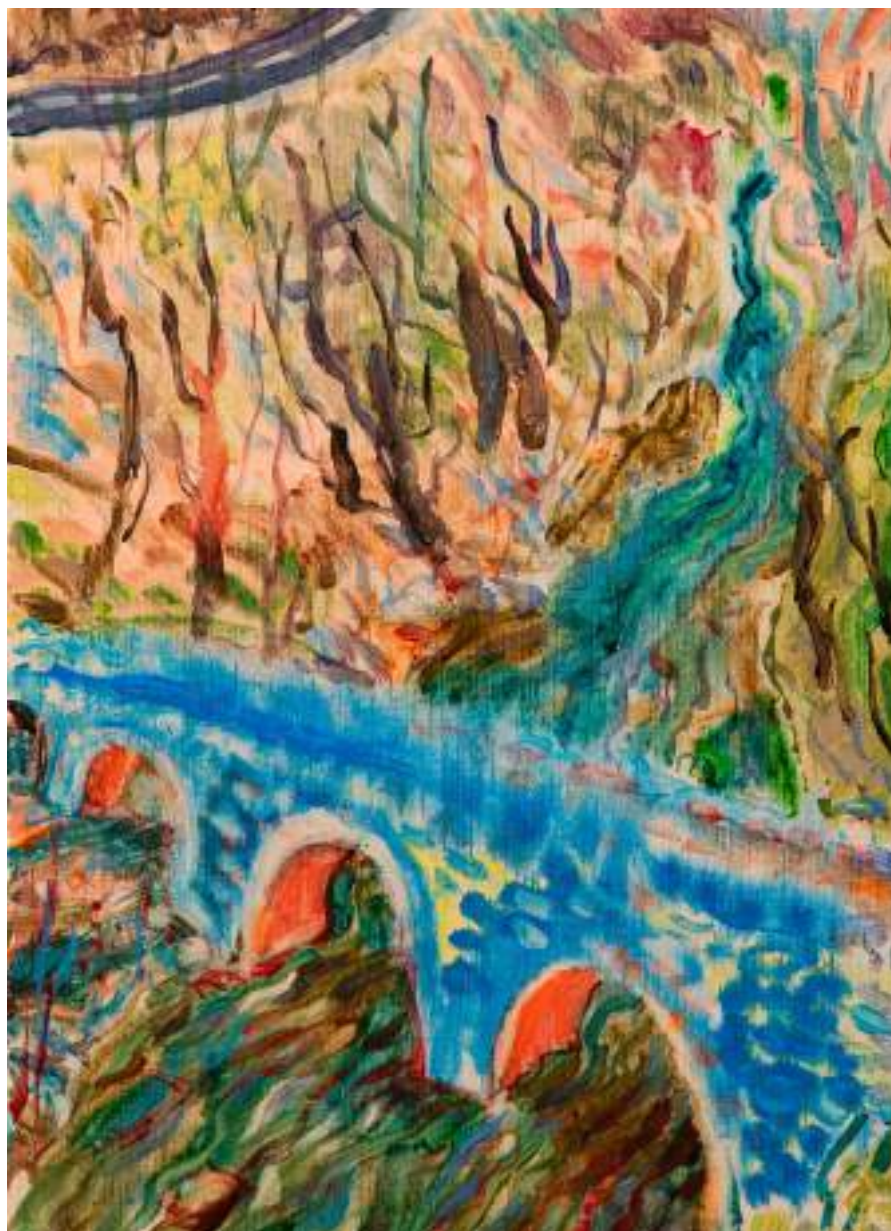
Pont II 35 x 25 cm Huile sur toile 2024