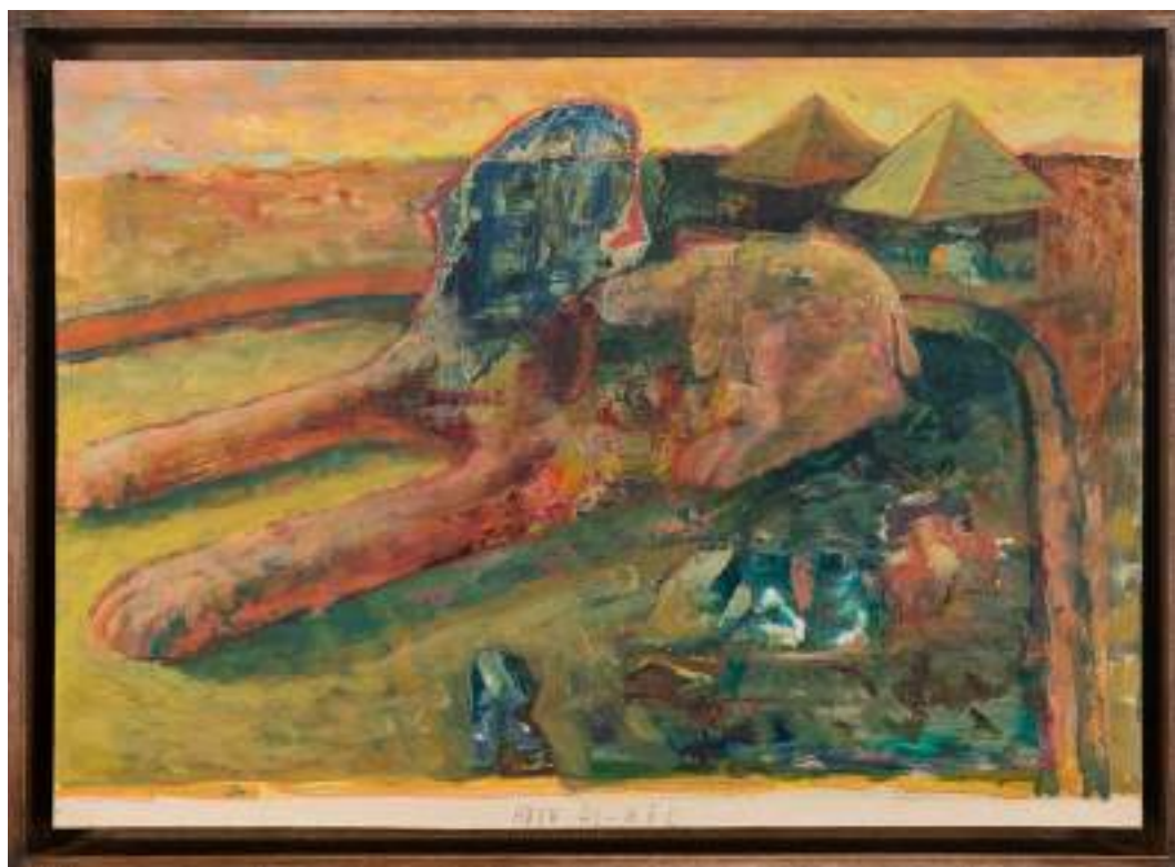
Abou Al Hôl 29 x 41 cm Huile sur papier 2025