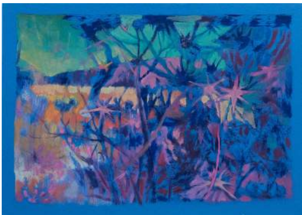
Chardons 23 x 33 cm Huile sur papier 2024