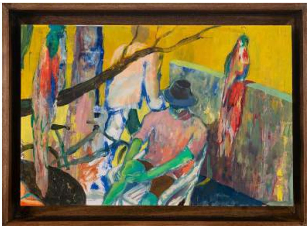
Oiseau bleu 18 x 28 cm Huile sur papier 2025