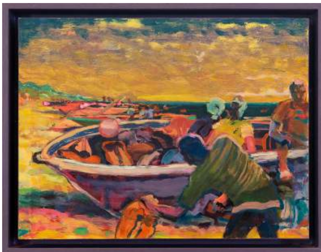
Viking 25 x 33 cm Huile sur bois 2026